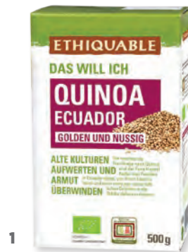
1 2100385 Quinoa Ecuador, 500g 5,90 €

Das Sortiment von Ethiquable besteht ausnahmslos aus fair gehandelten und biologisch angebauten Produkten. Die Zusammenarbeit mit Plantagen ist dabei tabu. Denn nur die kleinbäuerliche Agrarwirtschaft ist in der Lage, traditionelles Know-how und die genetische Vielfalt aufrecht zu erhalten.